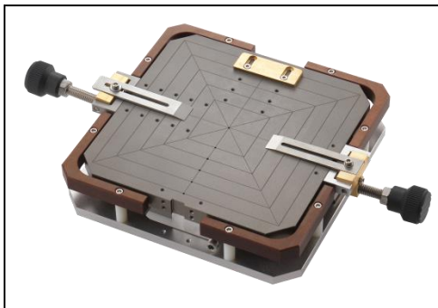
Vakuumaufnahme 6x6" mit mechanischer Klemmung