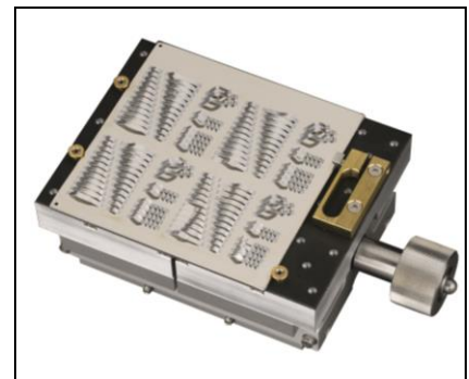
4x4" Substrataufnahme m. gummierter Oberfläche, mit mechanische Klemmung