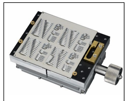
4x4" Substrataufnahme m. gummierter Oberfläche, mit mechanische Klemmung