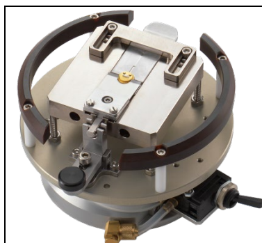
TO Aufnahme mit mechanischer Klemmung